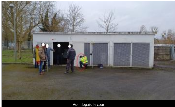
Vue depuis la cour.