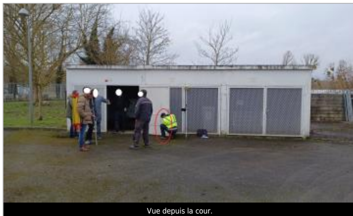
Vue depuis la cour.