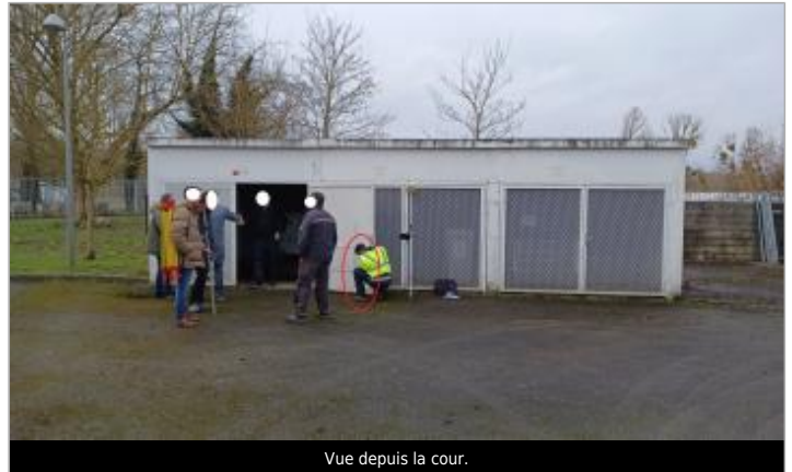
Vue depuis la cour.