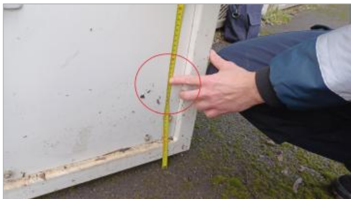
Laisse de crue à 26 cm/sol.