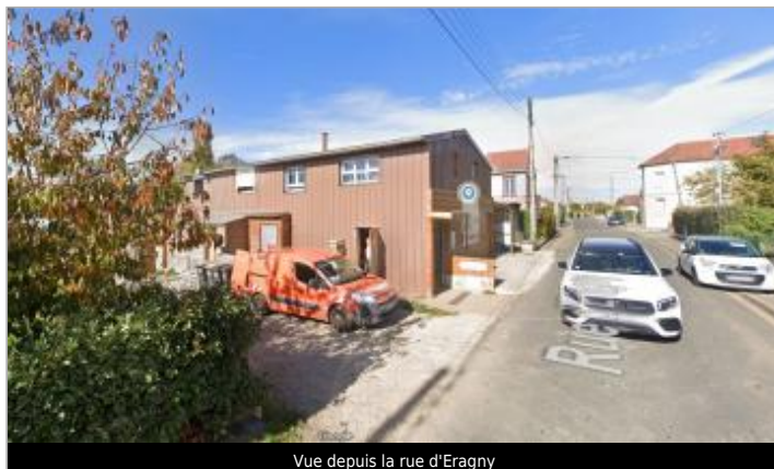
Vue depuis la rue d'Eragny