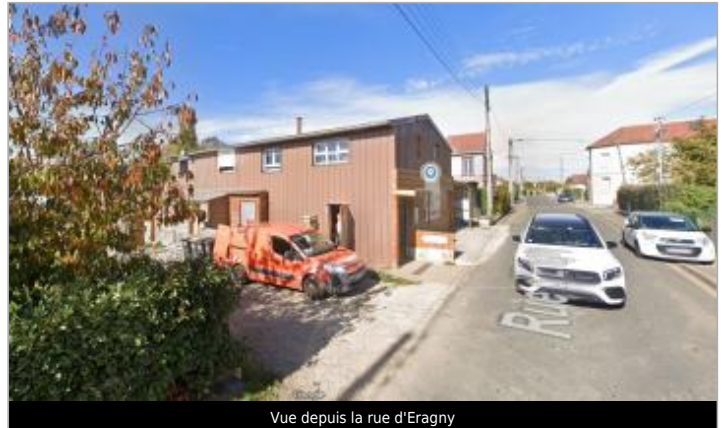
Vue depuis la rue d'Eragny