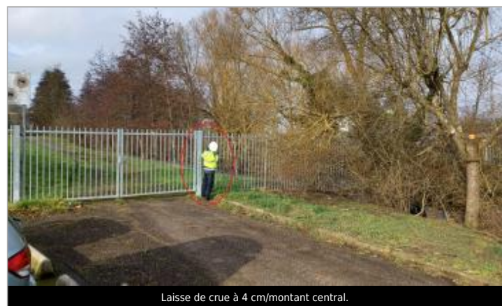
Laisse de crue à 4 cm/montant central.

GÉNÉRAL Code : WEB_R_202502192627 Date de mise à jour : 31/03/2025 Auteur : SPC.SACN