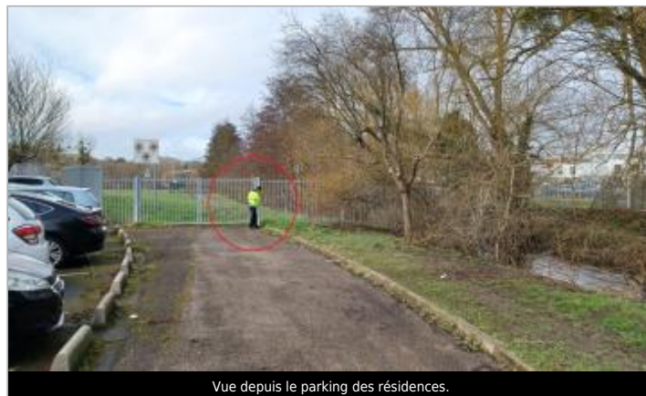
Vue depuis le parking des résidences.

GÉOLOCALISATION Coordonnées WGS84 : X: 1.77950663 / Y: 49.28388400 Coordonnées RGF93 (Lambert 93) X: 611185.89 / Y: 6910048.14 Coordonnées RGF93 (ETRS89) : X: 1.7795066 / Y: 49.283884 Code Hydro: H31-0400 Rive de référence: Droite