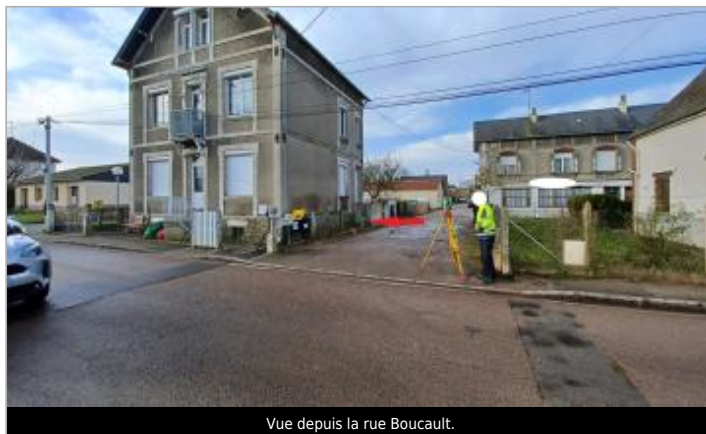
Vue depuis la rue Boucault.