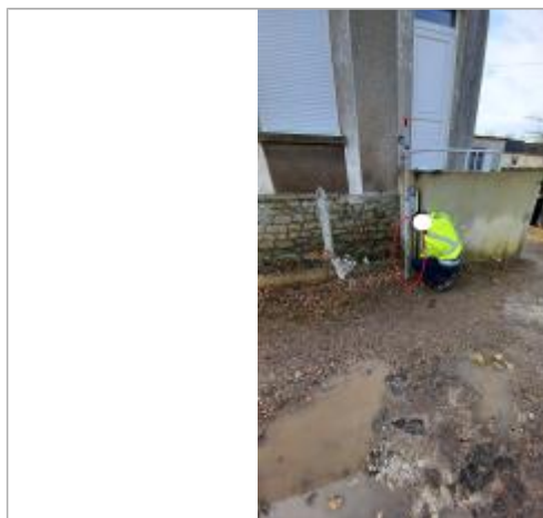
Laisse de crue à 45 cm/sol.