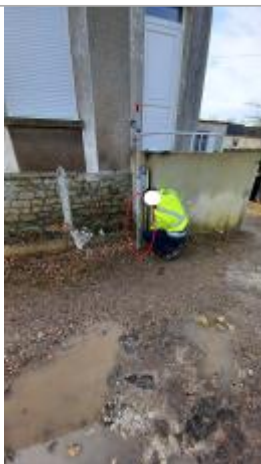
Laisse de crue à 45 cm/sol.

Altitude calculée de l'eau (en m) : 91.65