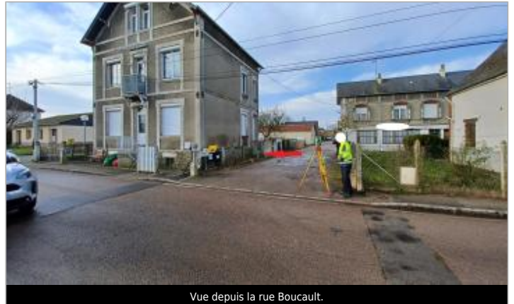
Vue depuis la rue Boucault.

Coordonnées WGS84 : X: 1.73089004 / Y: 49.48150730