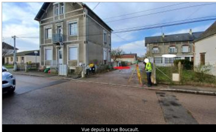
Vue depuis la rue Boucault.