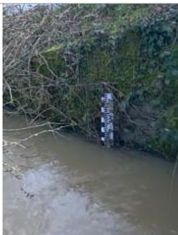
Echelle amont du pont le 30/01/2025 18:10 - cote 2.74-2.75m

Altitude calculée de l'eau (en m) : 20.109 m