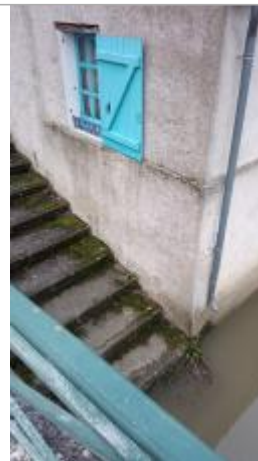
Vue sur le site