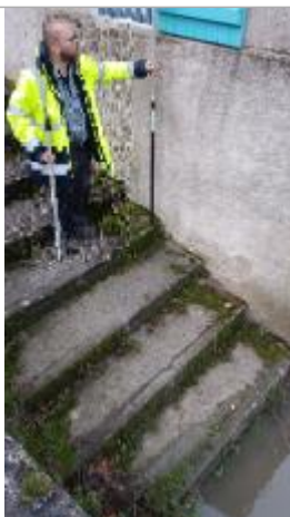
Vue sur le point de la mesure

Altitude calculée de l'eau (en m) : 56.11