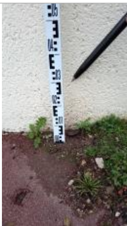
Vue sur le point de la mesure

Altitude calculée de l'eau (en m) : 64.82 m