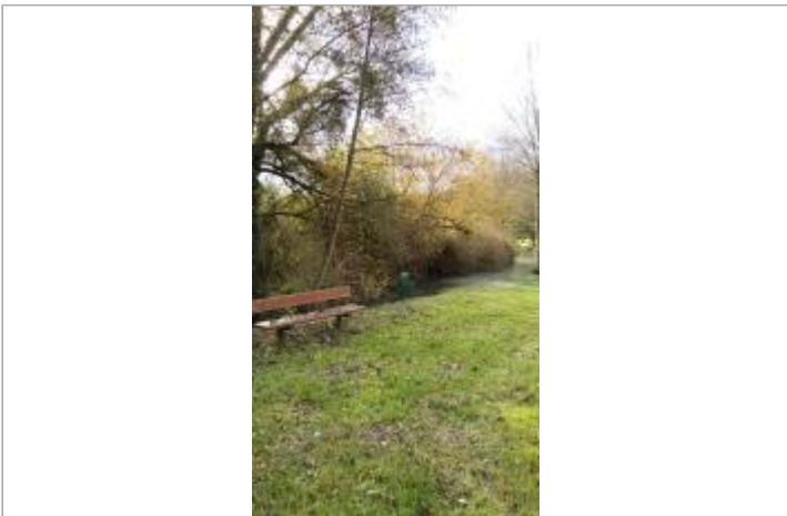
Vue sur le site

GÉOLOCALISATION Coordonnées WGS84 : X: 1.26522861 / Y: 48.05836000 Coordonnées RGF93 (Lambert 93) : X: 570774.34 / Y: 6774528.47 Coordonnées RGF93 (ETRS89) : X: 1.2652286 / Y: 48.05836 Code Hydro: M1--0160 Rive de référence: