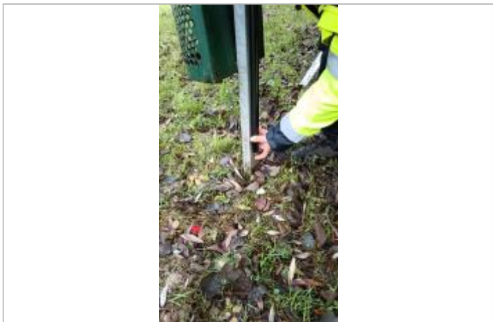
Vue sur la marque d'inondation laissée sur le poteau