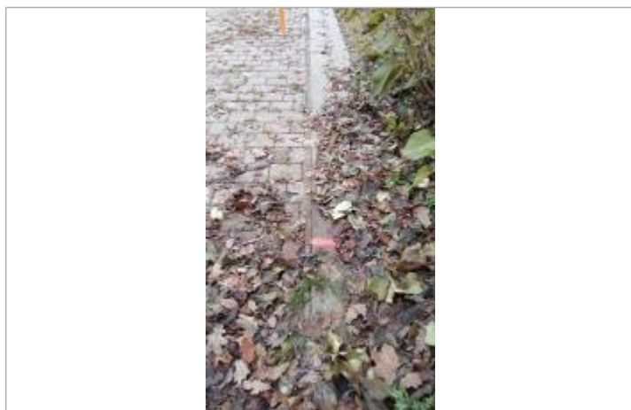
Vue sur le point de la mesure