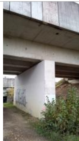
Vue du site situé sous le pont