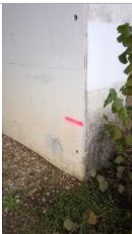
Vue sur le point de la mesure

Altitude calculée de l'eau (en m) : 76.3 m