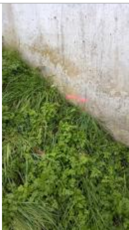
Vue sur le point de la mesure

Altitude calculée de l'eau (en m) : 77.28 m