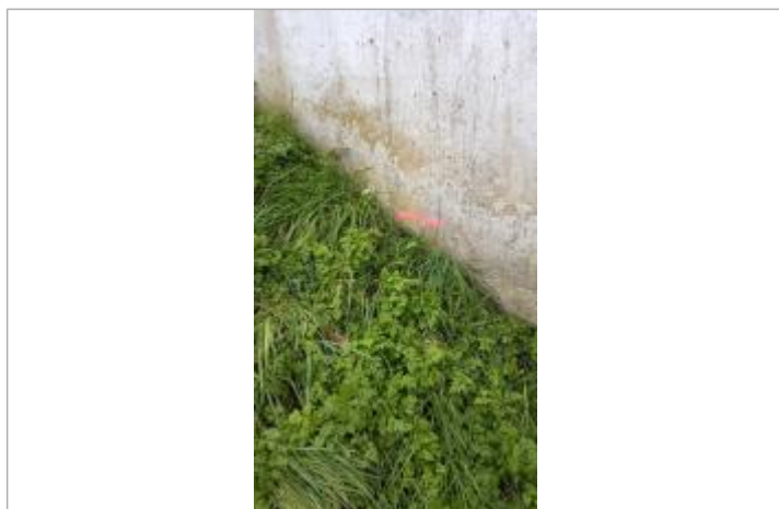
Vue sur le point de la mesure