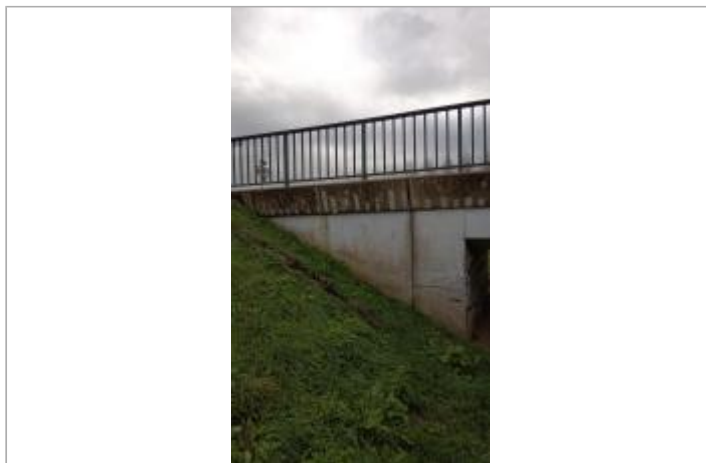
Vue sur le site

Coordonnées WGS84 : X: 1.02646000 / Y: 47.79713180