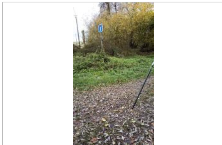
Vue sur le site

Coordonnées WGS84 : X: 1.28538782 / Y: 48.05850820