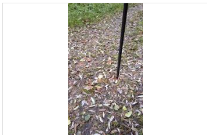
Vue sur le point de la mesure