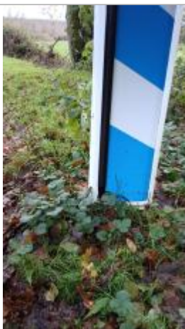
Vue sur le point de la mesure