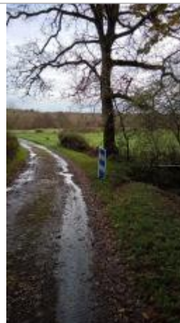
Vue sur le site