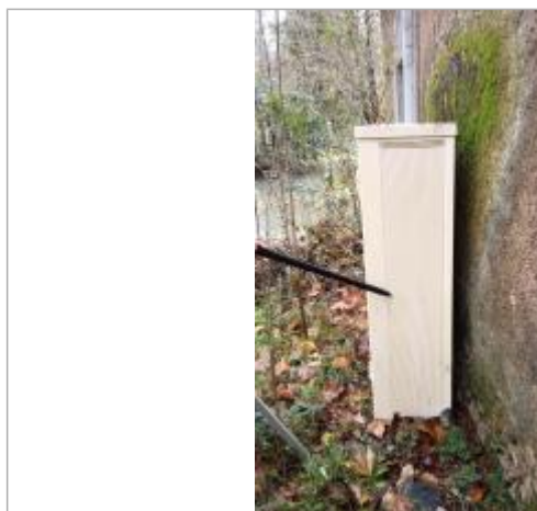
Vue sur le point de la mesure