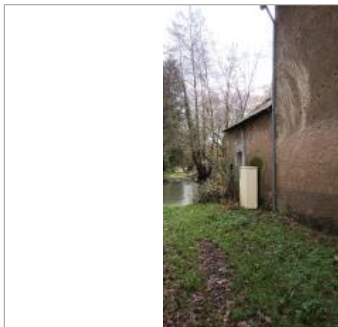
Vue sur le site

Coordonnées WGS84 : X: 1.37878331 / Y: 48.14646640