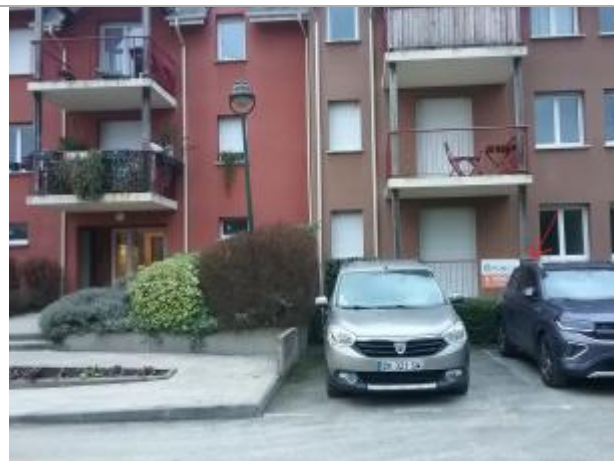
vue générale du site - situation du balcon par rapport à l'entrée du bâtiment C