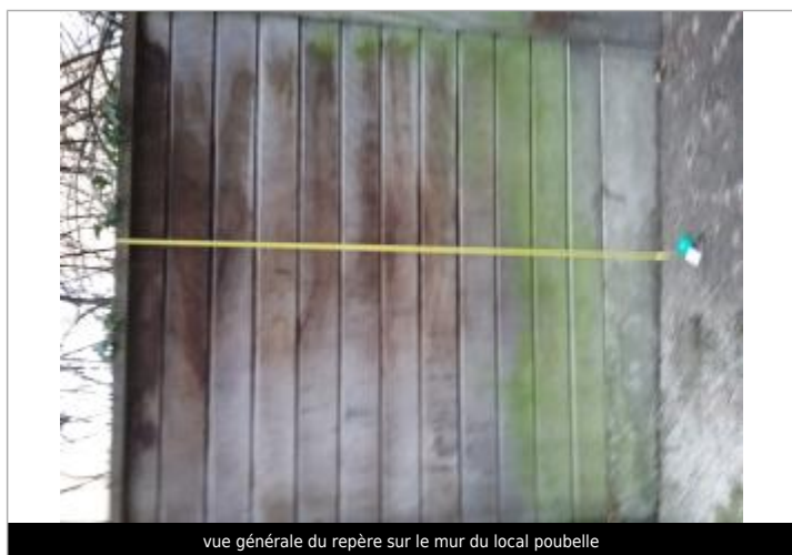
vue générale du repère sur le mur du local poubelle

NIVELLEMENT SPC SACN. LE SPC N'EST PAS GÉOMÈTRE EXPERT, LES COTES SONT DONNÉES À TITRE INDICATIF. - 10/04/2025