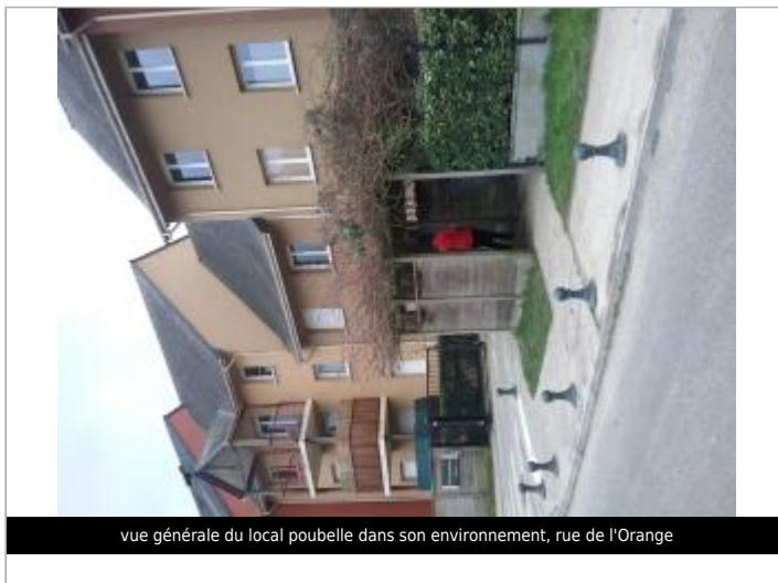
vue générale du local poubelle dans son environnement, rue de l'Orange