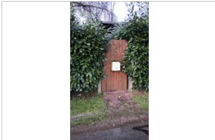
Vue sur la marque d'inondation laissée en bas de la porte

Coordonnées WGS84 : X: 1.37355961 / Y: 48.16666070