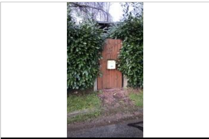
Vue sur la marque d'inondation laissée en bas de la porte

GÉOLOCALISATION Coordonnées WGS84 : X: 1.37355961 / Y: 48.16666070 Coordonnées RGF93 (Lambert 93) X: 579090.78 / Y: 6786389.65 Coordonnées RGF93 (ETRS89) : X: 1.3735596 / Y: 48.1666607 Code Hydro: M1--0160 Rive de référence: