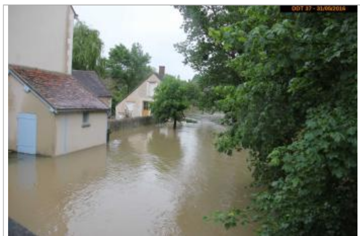
Photographie pendant la crue, le 31 mai 2016

Altitude calculée de l'eau (en m) : 91.826 m