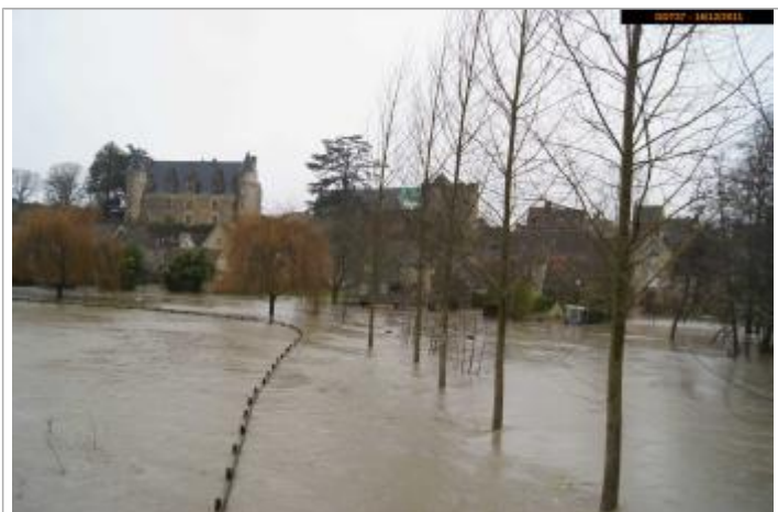
Photographie pendant la crue, le 16 décembre 2011