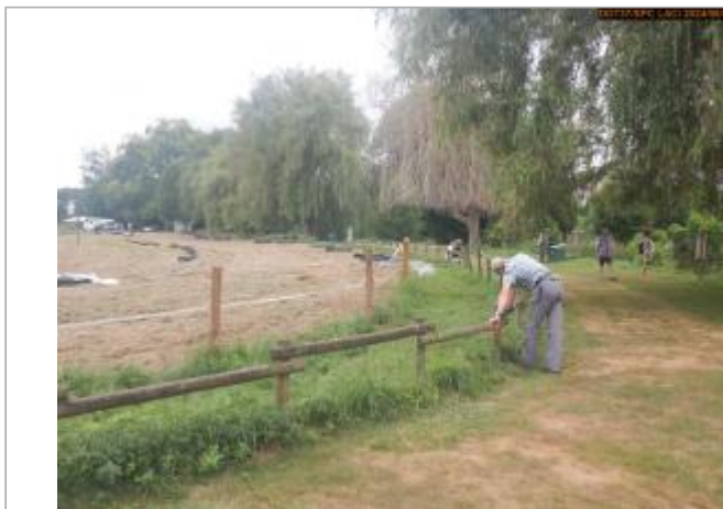
Vue du site en 2024, avec le repère de la crue de 2011

Coordonnées WGS84 : X: 1.20223475 / Y: 47.15465490