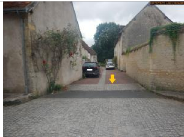
Vue du site en 2024, avec le repère de la crue de 2016