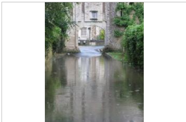
Photographie prise pendant la crue