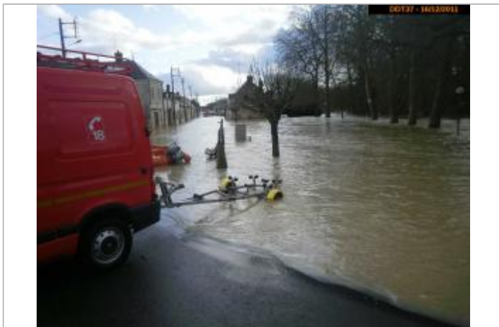
Photographie prise pendant la crue