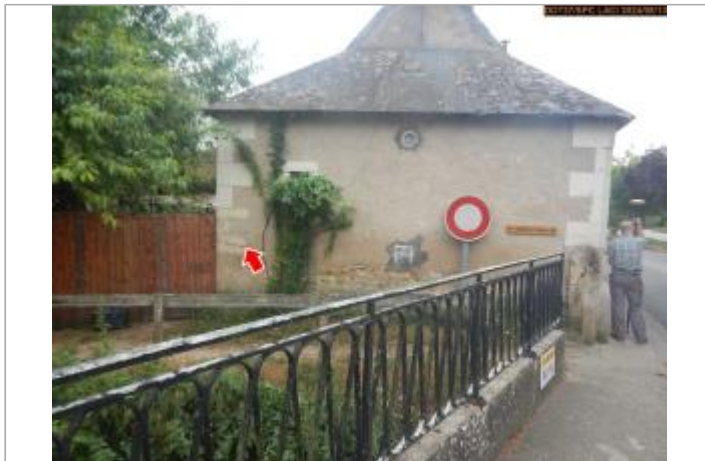
Vue du site en 2024, avec le repère de la crue de 2016