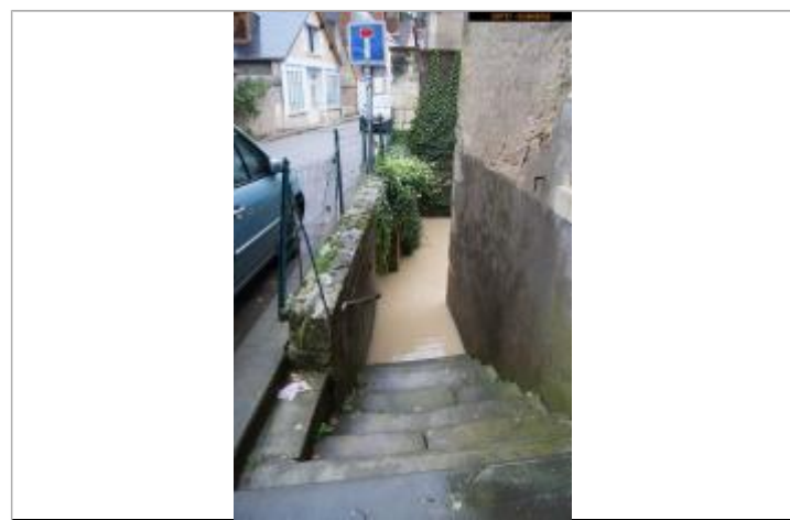
Photographie pendant la crue de juin 2016

GÉNÉRAL Code : 25LACII02_R_22_2 Date de mise à jour : 10/02/2025 Auteur : SPC LACI