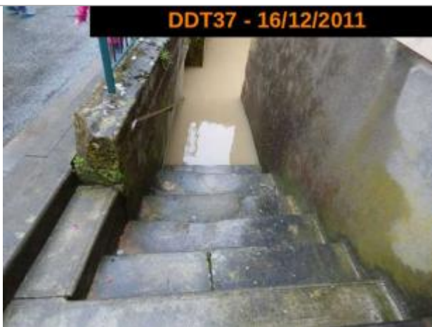
Photographie pendant la crue de décembre 2011

Altitude calculée de l'eau (en m) : 91.8