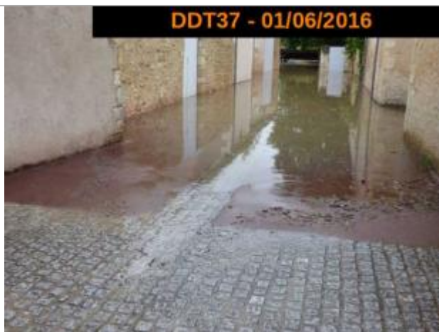
Photographie pendant la crue de juin 2016

Altitude calculée de l'eau (en m) : 91.854