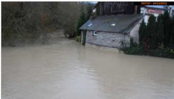
Photographie de la crue de 2011