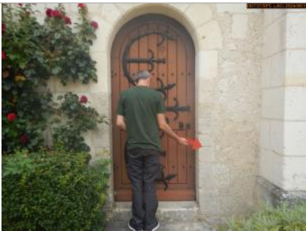
Vue du repère en 2024

Altitude calculée de l'eau (en m) : 105.91