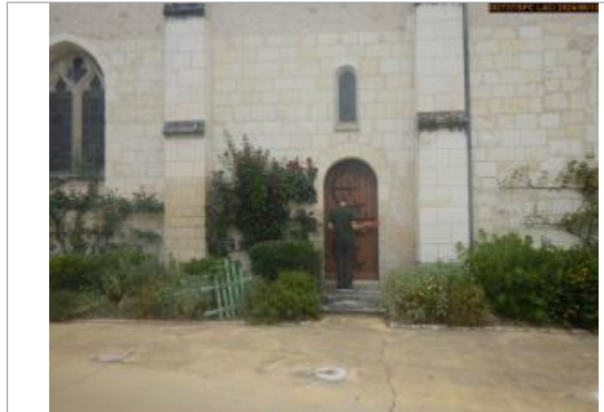
Vue du site en 2024, avec le repère de la crue de 1770

Coordonnées WGS84 : X: 1.21954854 / Y: 47.09244120