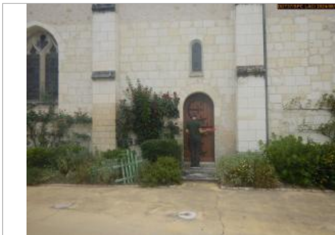
Vue du site en 2024, avec le repère de la crue de 1770

Coordonnées WGS84 : X: 1.21954854 / Y: 47.09244120