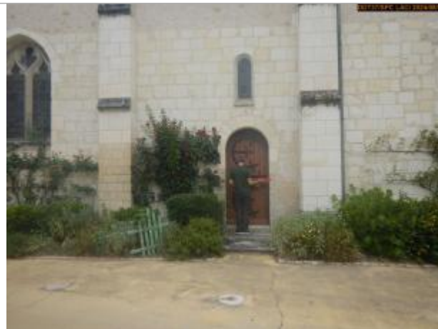
Vue du site en 2024, avec le repère de la crue de 1770