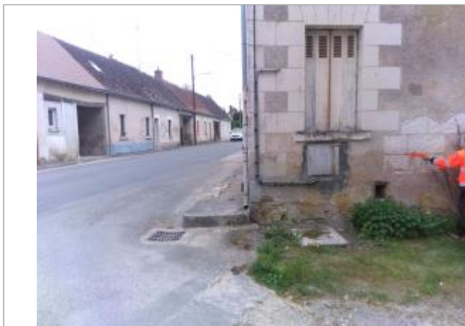
Vue du site en 2024, avec le repère de la crue de fin mars 2024