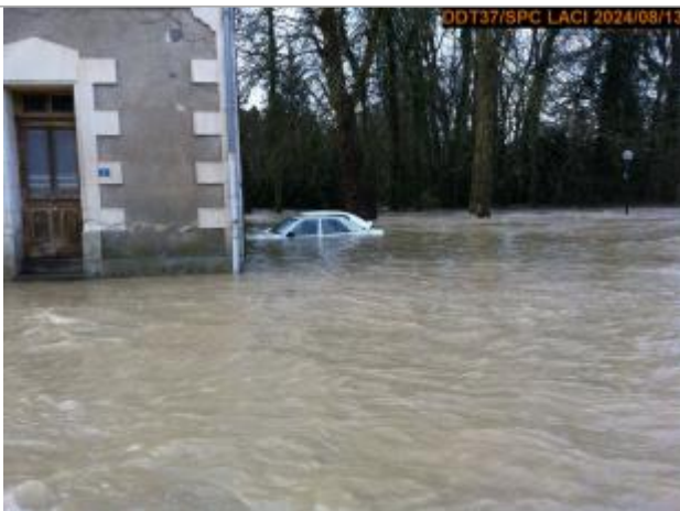
Photographie de la crue

Altitude calculée de l'eau (en m) : 104.421 m