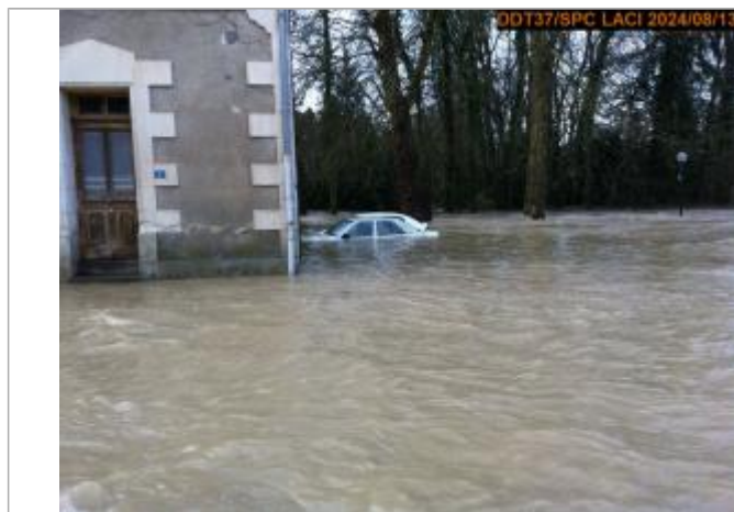
Photographie de la crue