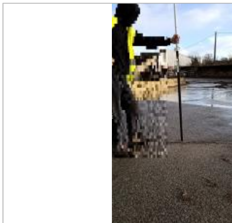
Vue sur la laisse d'inondation

Coordonnées WGS84 : X: -0.96090148 / Y: 47.82022130