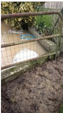
Vue sur le point de la mesure

Altitude calculée de l'eau (en m) : 34.56 m