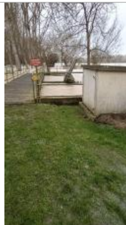
Vue sur le site