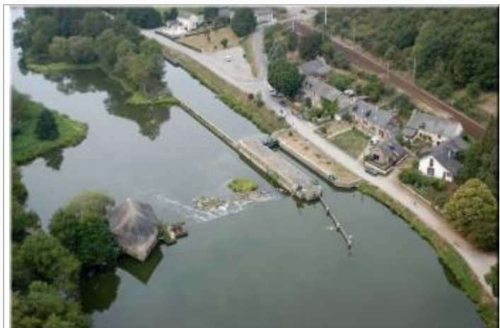
vue générale du site du Boel à Guichen