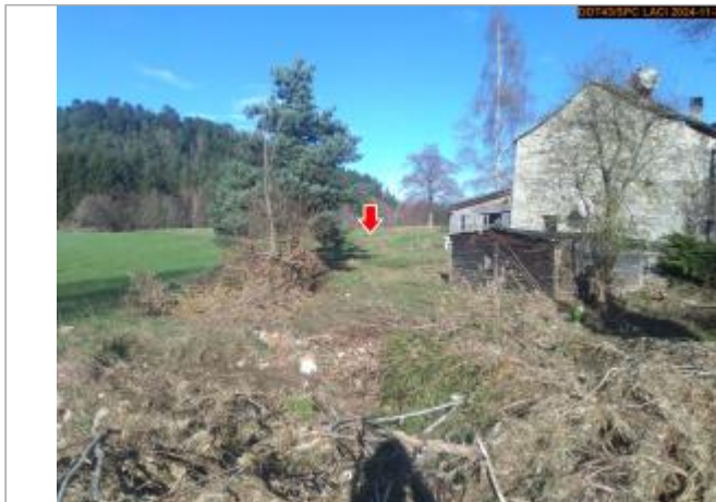
Vue du site en 2024, avec le repère de la crue du 17 octobre 2024

Coordonnées WGS84 : X: 4.27622047 / Y: 45.10625400