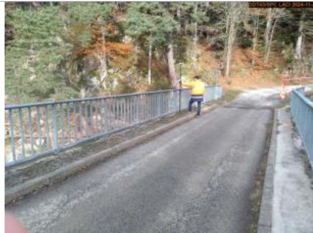
Vue du site en 2024, avec le repère de la crue du 17 octobre 2024

Coordonnées WGS84 : X: 4.28567638 / Y: 45.07537910