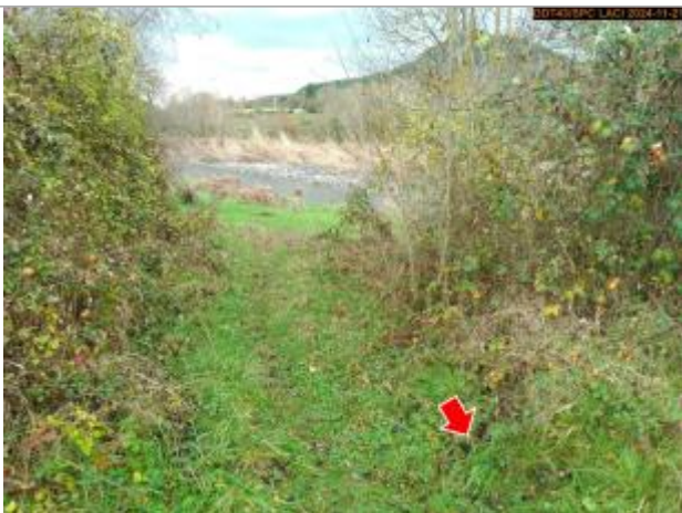
Vue du repère en 2024