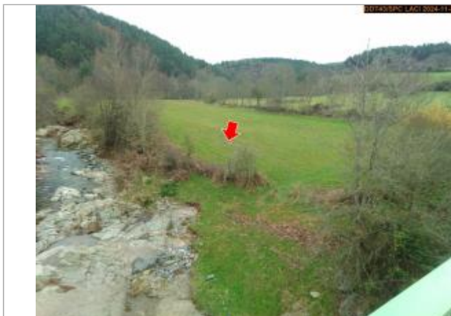
Vue du site en 2024 depuis le pont, avec le repère de la crue du 17 octobre 2024

Coordonnées WGS84 : X: 3.93626957 / Y: 44.95212800