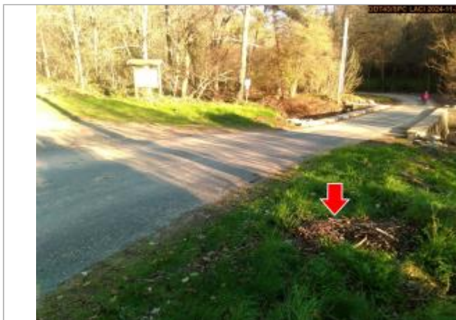
Vue du site en 2024, avec le repère de la crue du 17 octobre 2024

Coordonnées WGS84 : X: 4.21701832 / Y: 45.21690590