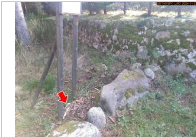
Vue du repère en 2024