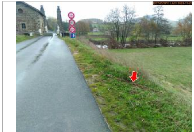
Vue du site en 2024, avec le repère de la crue du 17 octobre 2024

Coordonnées WGS84 : X: 3.92401533 / Y: 45.15316170