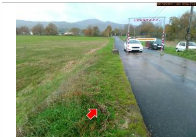
Vue du repère en 2024