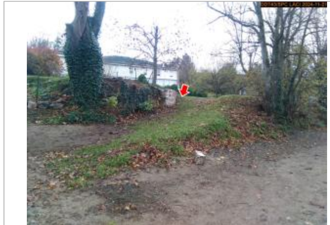
Vue du site en 2024, avec le repère de la crue du 17 octobre 2024

Coordonnées WGS84 : X: 3.90801556 / Y: 44.99636840