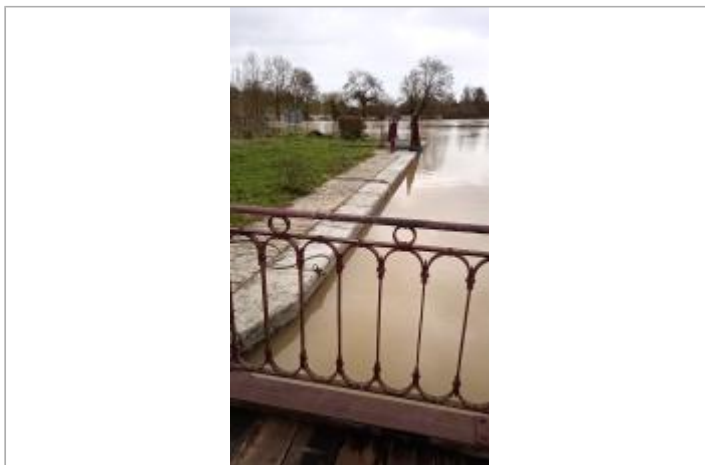
Vue sur l'écluse