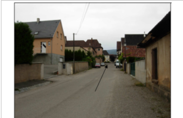
rue de l'Ecole

MARQUE Visibilité : Non renseigné État du repère : Non renseigné