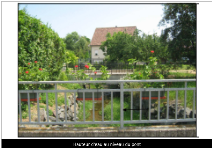
Hauteur d'eau au niveau du pont

Système altimétrique : NGF IGN 1969 (système normal) Altitude de la référence (en m) : 217.731 m Altitude calculée de l'eau (en m) : 217.731 m