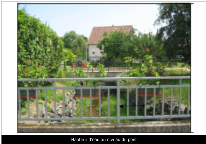
Hauteur d'eau au niveau du pont

Système altimétrique : NGF IGN 1969 (système normal) Altitude de la référence (en m) : 217.731 m Altitude calculée de l'eau (en m) : 217.731 m