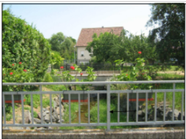
Hauteur d'eau au niveau du pont

Altitude calculée de l'eau (en m) : 217.731