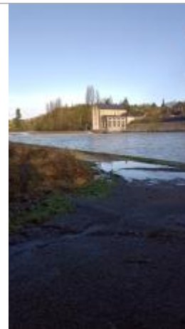
Vue sur la laisse d'inondation