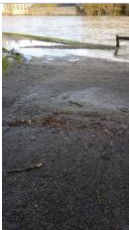
Vue sur le point de la mesure

Altitude calculée de l'eau (en m) : 39.97 m