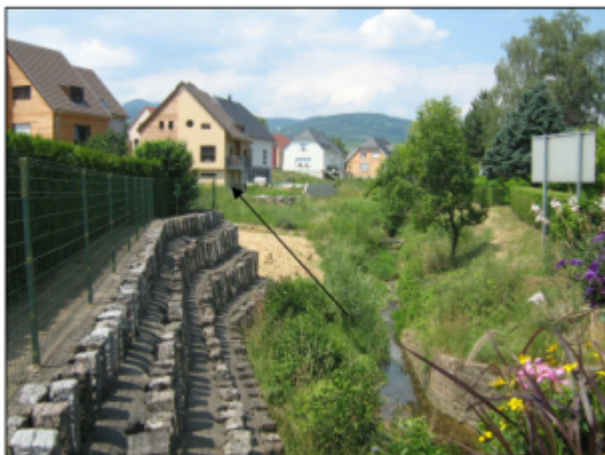
Maison rue de la Krutenau à Mittelwihr

Altitude calculée de l'eau (en m) : 223.65 m