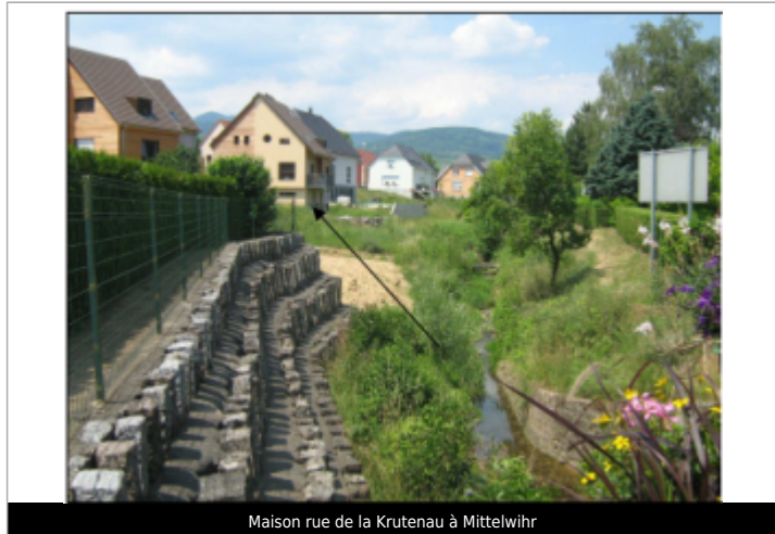
Maison rue de la Krutenau à Mittelwihr

Système altimétrique : NGF IGN 1969 (système normal) Altitude de la référence (en m) : 223.650 m Altitude calculée de l'eau (en m) : 223.65